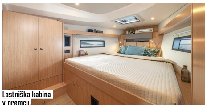
Lastniška kabina v premcu.