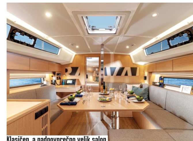
Klasičen, a nadpovprečno velik salon.

Velika odprtina za udoben sestop v podpalubje in dobro varovane stopnice so prvi vtis ob spustu v notranjost. C42 je možno naročiti z eno ali dvema kabinama v krmnem delu in eno ali dvema kopalnicama – dodatna je v premcu in zavzame precej