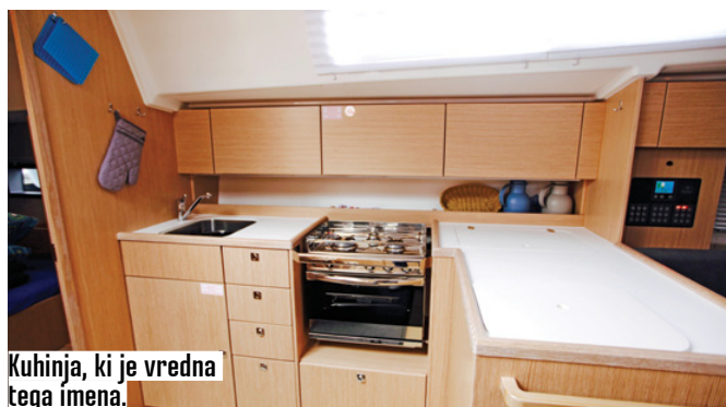
Kuhinja, ki je vredna tega imena.