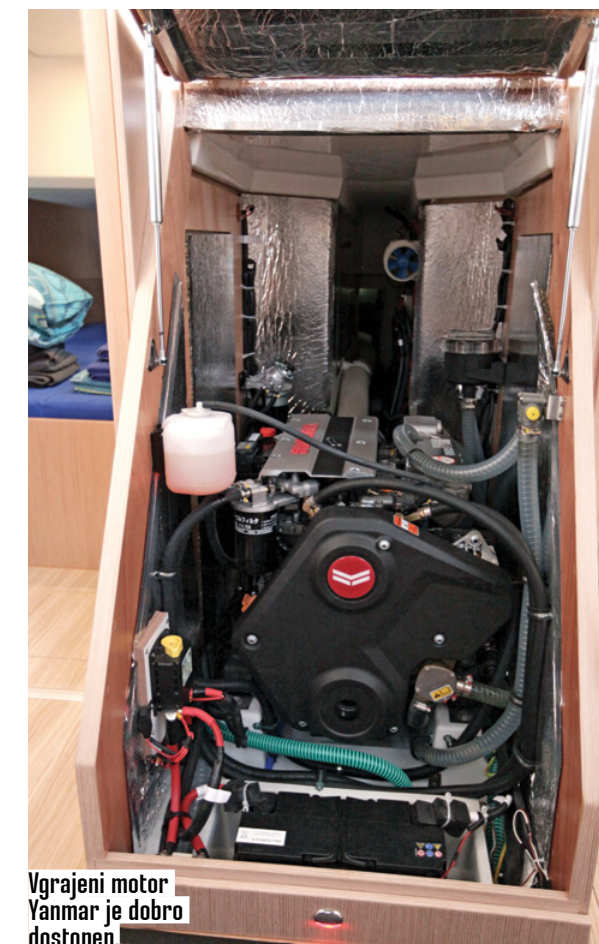
Vgrajeni motor Yanmar je dobro dostopen.