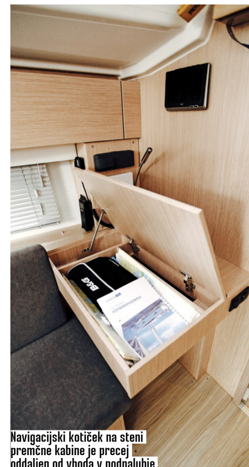
Navigacijski kotiček na steni premčne kabine je precej oddaljen od vhoda v podpalubje.