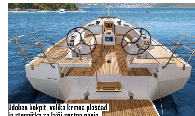
Udoben kokpit, velika krmna ploščad in stopnička za lažji sestop nanjo.

Pri C42 so dodali v premec nekaj volumna. To ni dobro le za jadrnalne sposobnosti, zaradi tega je tudi več prostora tudi v podpalubju.