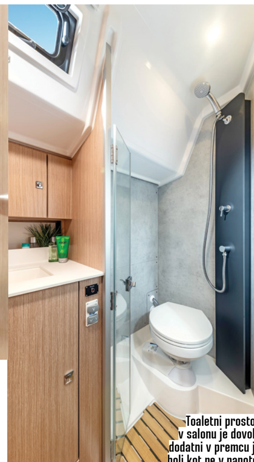
Toaletni prostor v salonu je dovolj, dodatni v premcu je bolj kot ne v napoto.