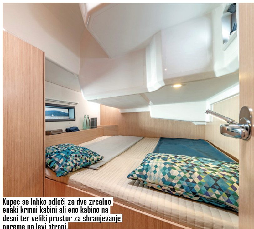
Kupec se lahko odloči za dve zrcalno enaki krmni kabini ali eno kabino na desni ter veliki prostor za shranjevanje opreme na levi strani.